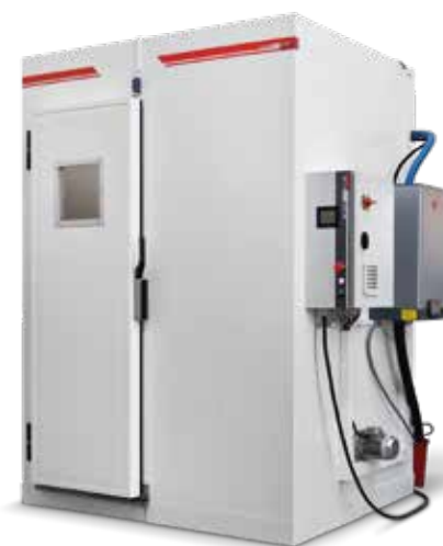
Customized Climatic Chambers