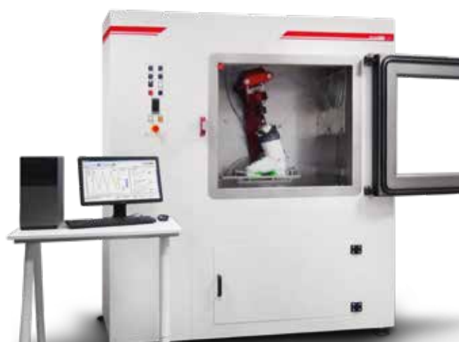
Special System for boot testing